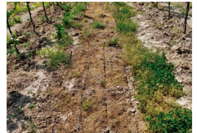
Die unterschrittene Pflanzendecke stirbt ab und schützt den Boden vor Sonneneinstrahlung, Austrocknen und Erosion.