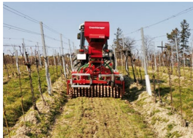
Der Grubber unterfährt den Bestand ohne zu mischen. Der Boden bleibt bedeckt: Wassersparend, Erosionsschutz.