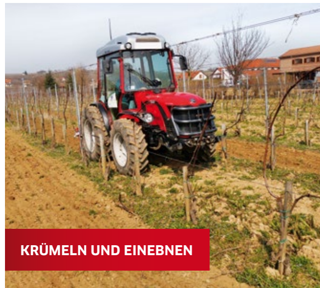
KRÜMELN UND EINEBNEN