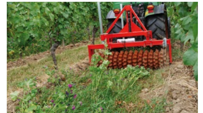
Niedrige Intensitätsstufe: Wachstum hemmen durch walzen.