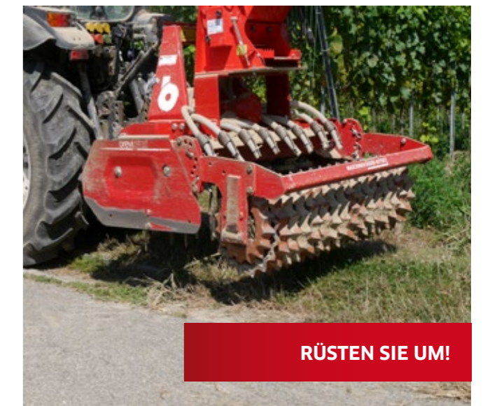
RÜSTEN SIE UM!