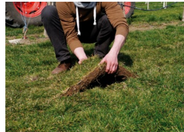
Höchste Intensitätsstufe: Wachstum stoppen durch Unterschneiden. Sollte es danach ausgiebig regnen, kann sich die Begrünung regenerieren und weiter wachsen. Sie können nichts falsch machen.