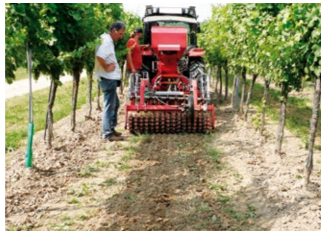
Ansaat von Blühstreifen in offenen Fahrgassen. Flaches wassersparendes Bearbeiten.